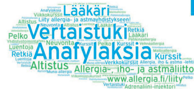
Anafylaksian kokeneet Allergia-, iho- ja astmaliitto