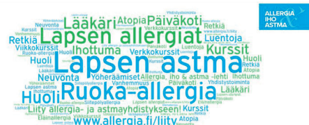
Allergia- ja astmalapset Allergia-, iho- ja astmaliitto