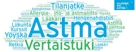
Astmaa sairastavat, Allergia-, iho- ja astmaliitto